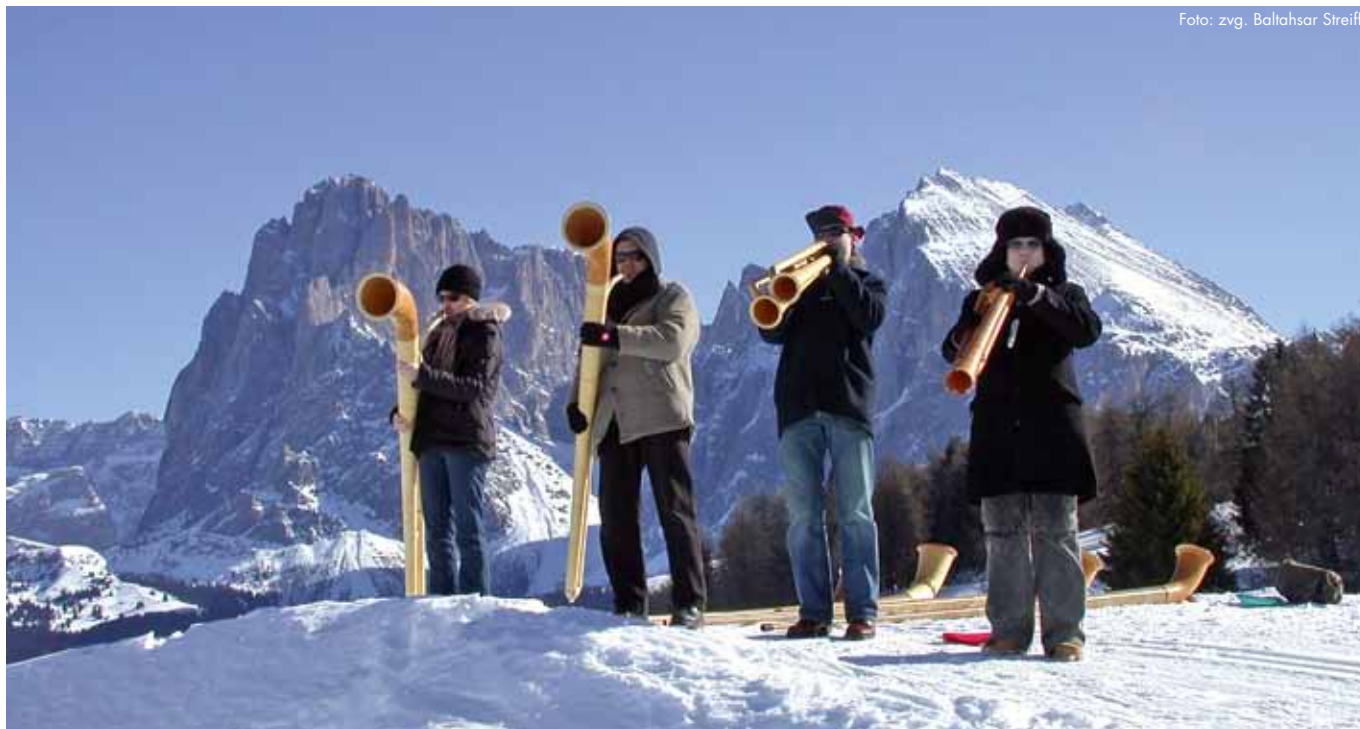
Das Ensemble «Hornroh» bei einem winterlichen Freiluft-Auftritt auf der Seiser Alm im Südtirol.